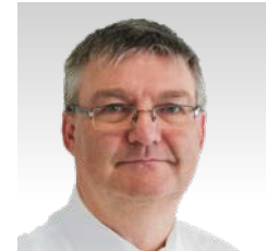
Guntram Aster Industrievertretung

Tel.: 02824-9 29 44 67 Mobil: 0163-1 52 68 34 janssen@niersbach.de